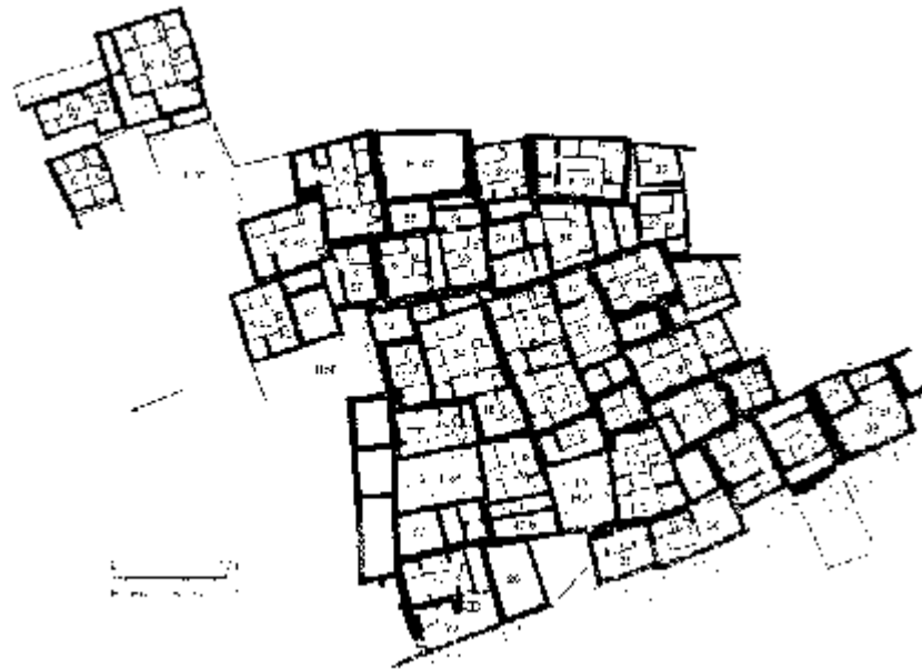
Plano de una sección de Zatal Juyuk

Todavía se realizan investigaciones en esta aldea, pero se ha estimado que en determinado momento tuvo cerca de 1,000 viviendas y unas 6,000 personas.