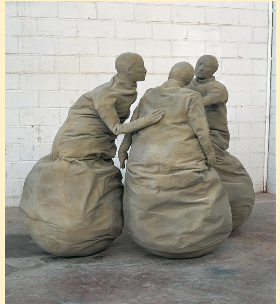
“Las Piezas de conversación”, Juan Muñoz

¿Qué contexto podrían estar representando las esculturas?