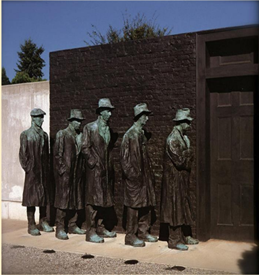
Depression Breadline, George Segal