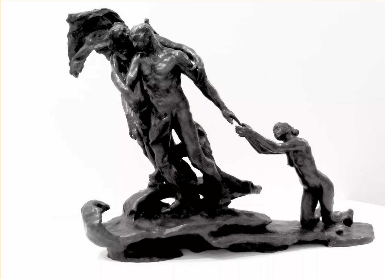
La edad madura, Camille Claudel