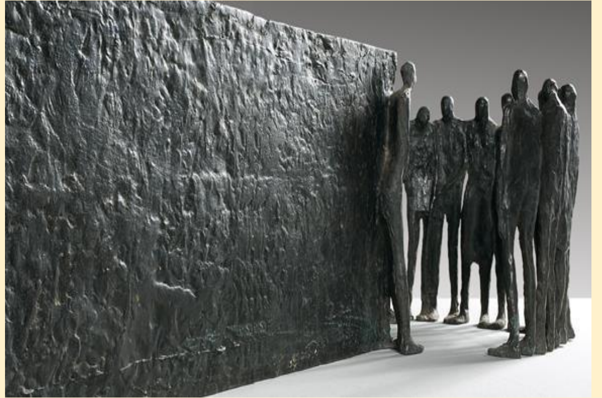
“Esquina de la democracia”

“Busco decir algo sobre el sentido de la vida y la muerte, el odio y el sufrimiento, la entrega a los demás: el amor. Para esto no hay lenguaje más apropiado que el del arte.” M.Irarrázabal.