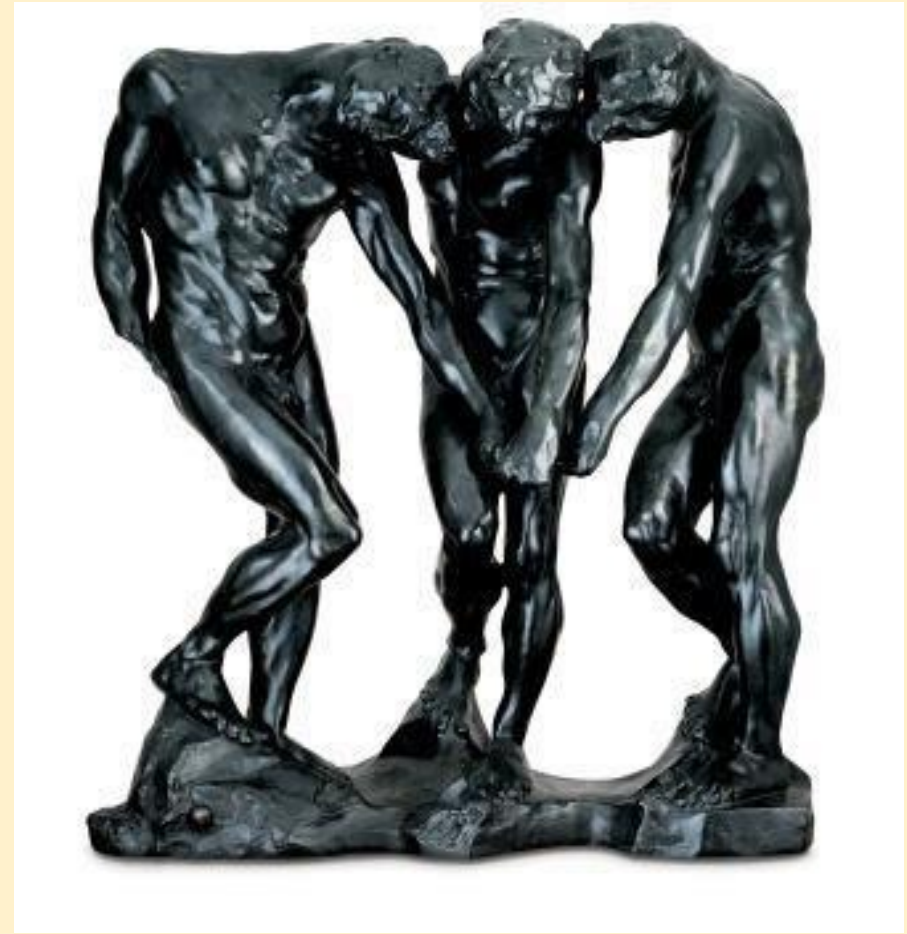
"La tres sombras", Auguste Rodin